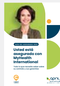
SU GUIA DEL ASEGURADO, QUE RESUME EL FUNCIONAMIENTO DE LA PÓLIZA Y RECOGE TODAS LAS DIRECCIONES Y TELÉFONOS DE INTERÉS.