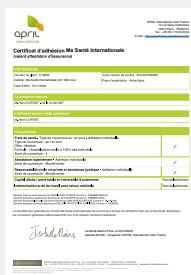
SU CERTIFICADO DE SEGURO,