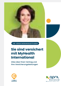
IHR VERSICHERUNGSLEITFADEN, DER DIE FUNKTIONSWEISE DES VERSICHERUNGSSCHUTZES ZUSAMMENFASST UND ALLE NÜTZLICHEN KONTAKTE ANGIBT